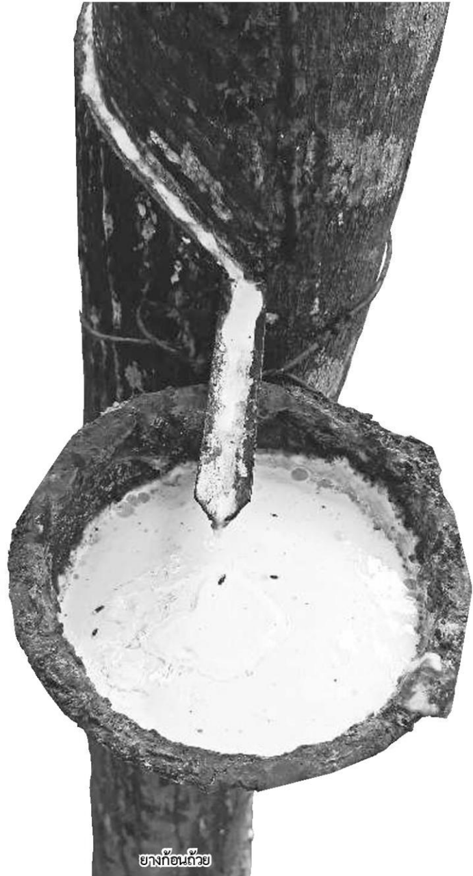
ยางก้อนถ้วย

รหัสข่าว: C-190618014010 (18 มิ.ย. 62/05:59)