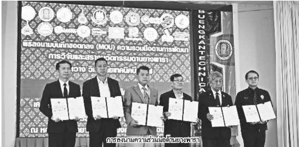
การลงนามความร่วมมือต่อยางพารา

หัวข้อข่าว: ผนึก23องค์กรเครือข่ายยางพาราทั่วไทยใช้'บึงกาฬโมเดล'ต้นแบบเพิ่มมูลค่ายาง